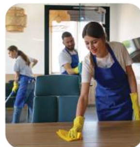
Aseo y Cafetería