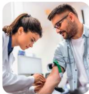
Exámenes de Ingreso y Egreso Laboral

Trabajamos con empresas que complementan nuestro portafolio para el cuidado integral de tu empresa, entre los servicios adicionales que ofrecemos están: